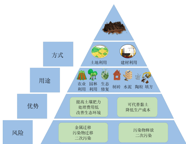
图1 清淤底泥的资源化利用方式

水库底泥以半固态和不溶性固体形式存在,研究发现,底泥中含有丰富的碳和其他元素,且性质接近黏土,底泥的颗粒较细,是一种很有应用前景的建筑材料、生物炭原料、填方材料和污水净化材料等 [14-19] 。例如,Zhou 等 [14] 提出了直接利用污泥制备瓦片的方法,将污泥直接掺入间歇式混合料中,不进行热动力干燥等预处理,经湿法球磨、压滤、碾磨、挤压成型、干燥、烧制得到劈裂砖,并进行了一系列实验和理化表征,结果表明:添加污泥的最大含量高达 60% (质量分数);1 210 °C 焙烧的劈裂瓦片的抗弯强度和吸水率分别为 25.5 MPa 和 1.14% (质量分数);并且样品具有良好的环境相容性。因此,利用底泥生产劈裂砖的工业应用将有助于显著减少底泥累积对环境的影响。利用底泥还可以制作陶粒材料,例如,梁标等 [15] 探究了将底泥烧制成陶瓷的工艺参数以及应用,为底泥应用于制陶工艺提供了思路。Maherzi 等 [16] 还将收集的底泥沉积物和疏浚砂的混合物用道路液压粘合材料处理。按照法国石灰和/或水硬性粘合剂土壤处理技术指南的建议制备配方并进行表征,发现两种水硬性粘合剂的机械阻力结果非常相似,在扫描电子显微镜分析中观察到,两种水硬性粘合剂都会导致道路材料膨胀,这一方面受到钙矾石数量的影响,另一方面受到孔隙材料中含水量的影响。