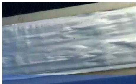
图 2 丁基铝箔胶带

为了隔绝雨水下渗,本项目在相对应的屋面上利用新型材料丁基铝箔胶带和防水自粘卷材处理整个屋面的防水,将丁基铝箔胶带插入组件内部即可,实践发现效果有明显作用。丁基铝箔胶带如图 2 所示,图 3 为胶带与组件不同安装方式。