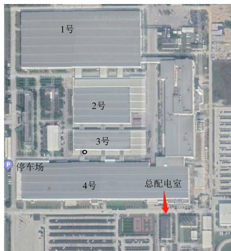
图 1 光伏发电屋顶分布俯视图

为了隔绝雨水下渗,本项目在相对应的屋面上利用新型材料丁基铝箔胶带和防水自粘卷材处理整个屋面的防水,将丁基铝箔胶带插入组件内部即可,实践发现效果有明显作用。丁基铝箔胶带如图 2 所示,图 3 为胶带与组件不同安装方式。