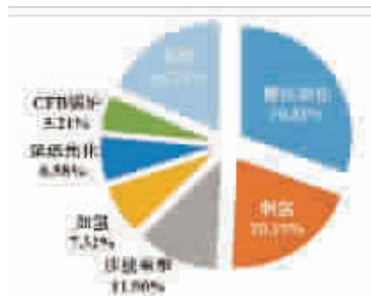
图 3 某燃料型炼厂各个装置的 CO 2 排放比例

在企业的各炼油装置中, CO 2 排放量比较大的装置一般有催化裂化、制氢、连续重整、延迟焦化、加氢和常减压等。图 3~图 5 为不同类型企业各炼油装置的 CO 2 排放比例。