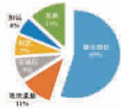
图5 某燃料-润滑油型企业各个装置的 CO 2 排放比例

图4数据表明：对某典型的炼化一体化炼厂，制氢装置的 CO 2 排放量最大，其次是常减压、催化裂化、加氢裂化、连续重整和延迟焦化等。因缺少化工板块的基础资料，所以图4数据仅代表该类型企业的炼油板块 CO 2 排放比例。