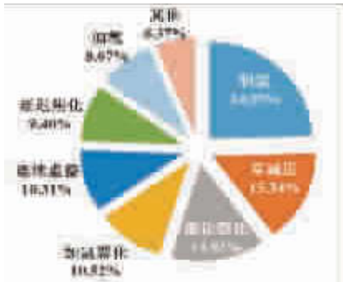
图4 某炼化一体化炼厂各个装置的 CO 2 排放比例

图4数据表明：对某典型的炼化一体化炼厂，制氢装置的 CO 2 排放量最大，其次是常减压、催化裂化、加氢裂化、连续重整和延迟焦化等。因缺少化工板块的基础资料，所以图4数据仅代表该类型企业的炼油板块 CO 2 排放比例。