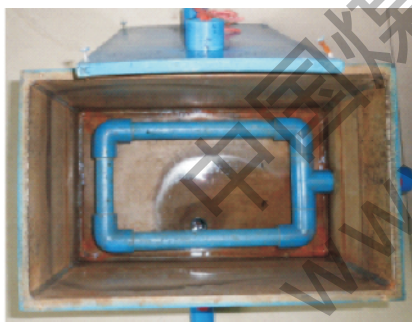
图 1 脱氮装置实物图

脱氮装置为 PVC 材质的长方体容器,容积为 5 L,每次试验加入 3 L 废水,用 30% 的片碱溶液调整 pH, 试验过程保持 pH 不变,用电热棒加热并维持水温在 45℃~50℃,在装置的底部布有曝气管,用电磁式空气泵进行曝气。脱氮装置图如图 1 所示,试验所需的仪器见表 1。