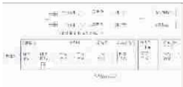
图 1 罐区 VOCs 回收的冷凝+吸附工艺

冷凝+吸附工艺是将逸散油气通入冷凝装置中,经多级冷凝,系统分别达到 17 ℃(分离碳九)、13.5 ℃(分离对二甲苯)、6 ℃(防止苯结晶)、2 ℃~4 ℃(除水)、-23 ℃(分离邻二甲苯)、-35 ℃~-40 ℃、-70 ℃~-75 ℃ [46] ,得到的液体油品分离后,再将剩余气体依次回到前级冷凝装置进行热交换,复热至 10 ℃导入活性炭(钝化)吸附装置进行吸附,此时气体中的油气浓度较低,含有较长分子链的烃类较少,易解析干净,且吸附解吸次数较少,吸附系统运行压力小,吸附剂不易中毒,活性炭使用寿命较长,回收率≥97%,达标气体排放,并对接近饱和的吸附罐进行微热真空脱附(35 ℃) [46,47] 。具体见图 1。该法可消除单一吸附法吸附剂床层温升隐患,系统独立性强,操作弹性大,且能耗与投资较单一冷凝法低,经济效益好,便于撬装化,运输及安装方便,占地面积小,适合高浓度、大流量挥发油气的处理 [48,49] 。