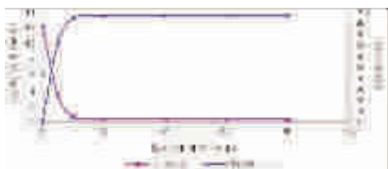
图 1 硫酸改性脱硫灰除磷试验

从上试验结果可以看出,用硫酸改性后的脱硫灰对磷化废水除磷效果显著,随着脱硫灰投加量的增加,磷酸盐的去除率随之提高。当投加量达到 10 g/L 时,其去除率达到 94% 以上,出水磷酸根浓度为 0.72 mg/L,当再增加投加量时,去除效果提升幅度较小。因此,脱硫灰投加量取 10 g/L 为宜。